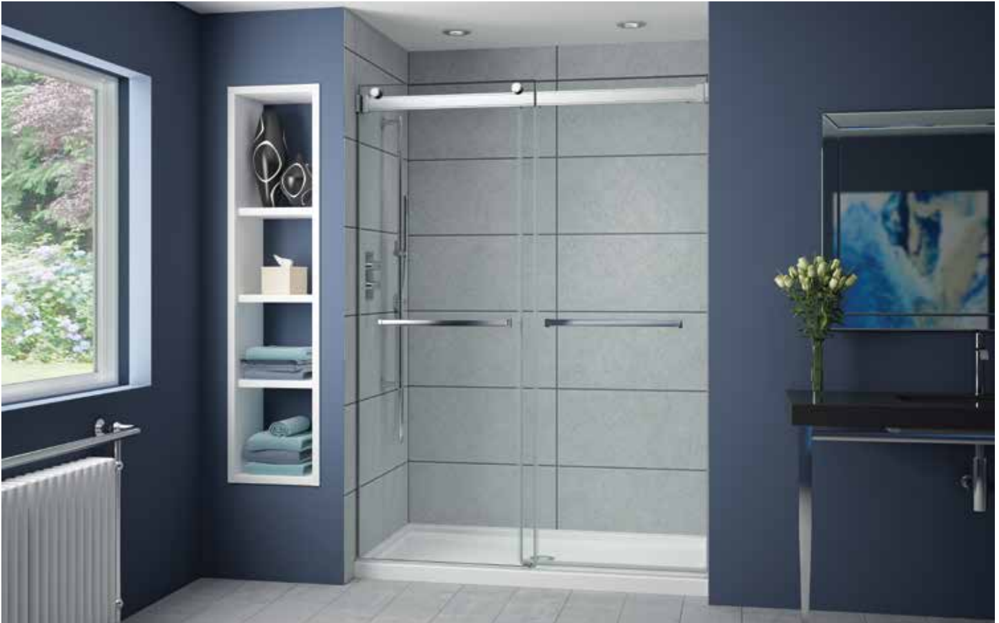
Model shown / Modèle présenté : NPS160-11-40

Bypass sliding doors / Portes coulissantes bidirectionnelles